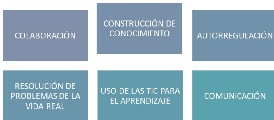
ILUSTRACIÓN 3 COMPTENCIAS DEL SIGLO XXI

Partiendo de la identificación de las competencias para el siglo XXI, debemos establecer un itinerario para llegar a plantear metodologías y actividades que incidan en los aprendizajes, así como aportar instrumentos de autoevaluación de la práctica docente para detectar la calidad de las actividades o tareas planteadas. Se