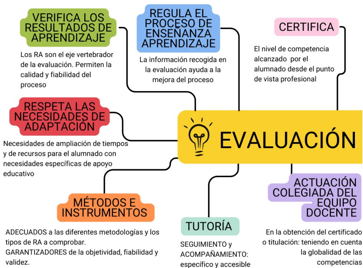
ILUSTRACIÓN 2 FACTORES IMPLICADOS EN LA EVALUACION

La evaluación debe ser continua y tener carácter formador para el alumnado, de tal manera que le permita desarrollar estrategias de autoaprendizaje y la autoevaluación. (Artículo 32 del Decreto 4/2010, de 28 de enero y artículo 6 de la Orden EDU/66/2010, de 16 de agosto).